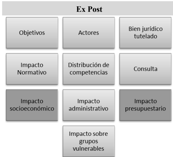
FIG 1 – EVALUACIÓN DE IMPACTO LEGISLATIVO EX POST